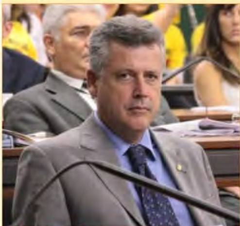
Senador Rodrigo Rollemberg: Eles contribuem como Os demais trabalhadores

A Câmara analisa um Projeto de Lei, do Senado, que concede novos direitos aos aposentados que permanecerem ou voltarem ao trabalho em atividades regidas pelo Regime Geral da Previdência Social. Pela proposta, esses profissionais passarão a desfrutar de benefícios que deixaram de receber em razão da aposentadoria. Assim, eles voltarão a receber o auxílio-doença, o auxílio-acidente e o apoio do serviço social. Atualmente, os aposentados que continuam trabalhando têm direito apenas ao salário-família e à reabilitação profissional.