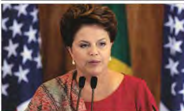
Dilma Rousseff: medida impactaria o desenvolvimento de Programas Sociais do Governo

A presidente Dilma Rousseff vetou integralmente o Projeto de Lei Complementar que acabava com a multa adicional de 10% do Fundo de Garantia por Tempo de Serviço (FGTS) pago pelas empresas nos casos de demissões sem justa causa. Para vetar o projeto, a Presidente argumentou que a extinção da cobrança da contribuição social geraria um impacto superior a três bilhões de reais por ano nas contas do Fundo de Garantia por Tempo de Serviço, além de reduzir investimentos em importantes programas sociais e em ações estratégicas de infraestrutura, notadamente naquelas realizadas por meio do Fundo de Investimento (FI) e do FGTS. Ainda de acordo com o Planalto, a medida impactaria fortemente o desenvolvimento do Programa Minha Casa, Minha Vida, cujos beneficiários são majoritariamente os próprios correntistas do Fundo.